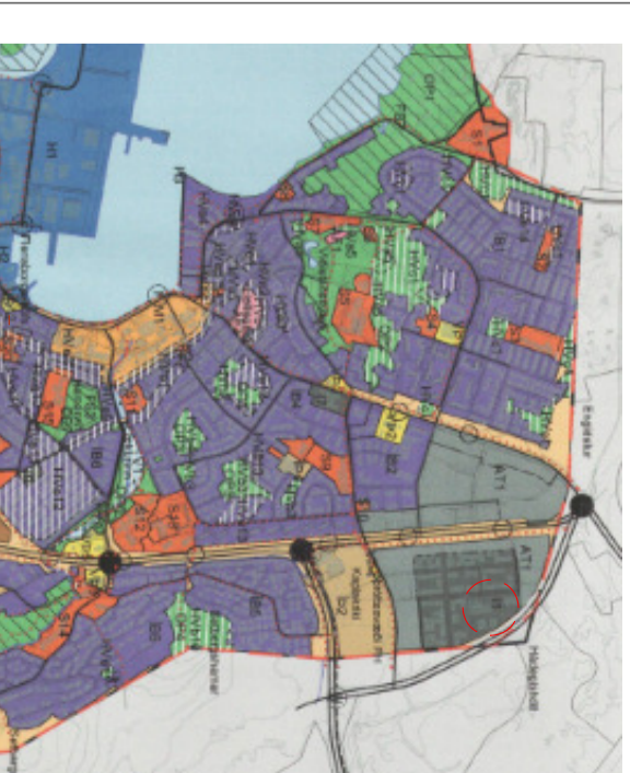
Hluti af aðalskipulagi Hafnarfjarðar. (2013-2025).

Leyfileg hámarks mænishæði bygginga er: 9,5 m.